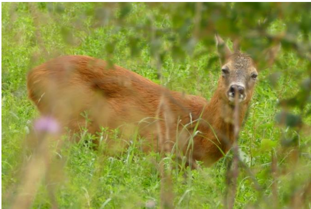
Wildtier des Jahres: das Reh